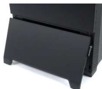
フロントヒドゥンベイ (スナップイン式)