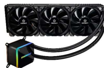
360mm x 28mm ラジエーター 水冷ユニット (TDP ≤ 500W)