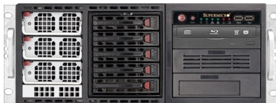
フロント(2+1リダンダント電源仕様)