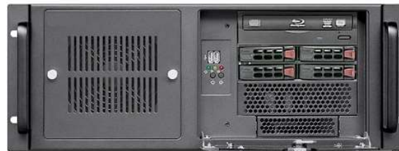
DVDドライブ+4*2.5”ドライブベイ