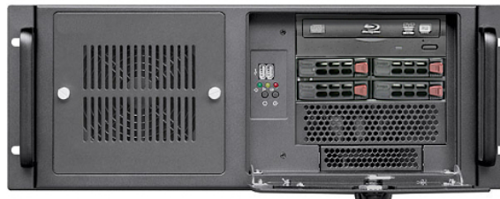
DVDドライブ+4*2.5”ドライブベイ