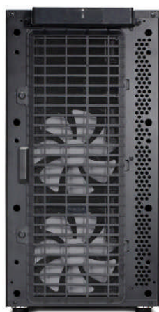
フロント(ドア取外)