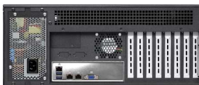
リア(シングル電源)