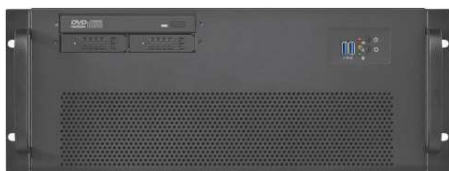
フロント(DVD+2*2.5"ベイオプション)