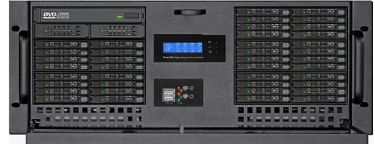
フロント(40*2.5" リムーバブルベイ)