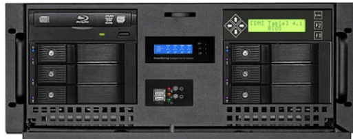
フロント(ODD+6x3.5"ベイ+キャラクターLCD)