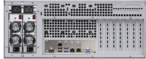
リア(リダント電源モデル)