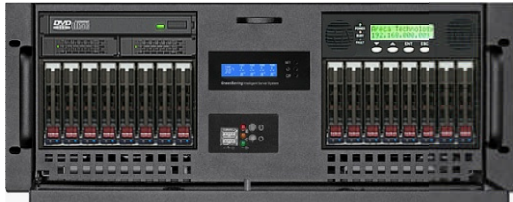
フロント(RAID Cont.+12Gbps 8*2.5" リムーバブルベイ)