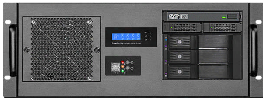
フロント(Slim ODD+2x2.5"ベイ+3*3.5" リムーバブルベイ)