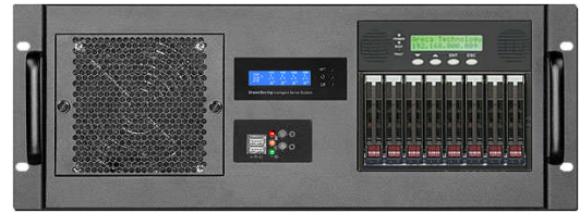
フロント(8*2.5" 12Gbps リムーバブルベイ+RAID コントローラ)