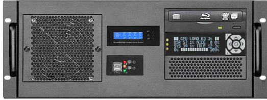
フロント(ODD+グラフィック LCD)