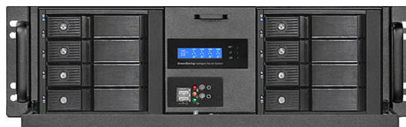
フロント(8*3.5" リムーバブルベイ)