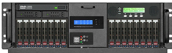
フロント(ODD+6*3.5"ベイ+キャラクターLCD)