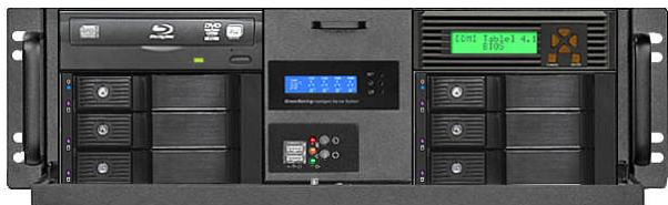
フロント(12Gbps 16*2.5"ベイ+RAID Cont.)