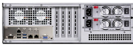
リア(リダundant電源モデル)