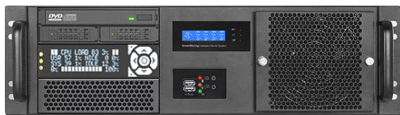
フロント (Slim ODD+2x2.5"ベイ+キャラクターLCD)