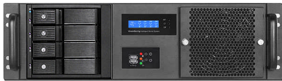
フロント (4*3.5" リムーバブルベイ)