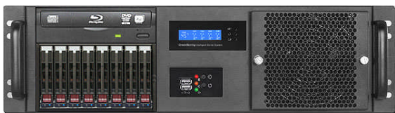
フロント (ODD+12Gb/s 8*2.5" リムーバブルベイ)