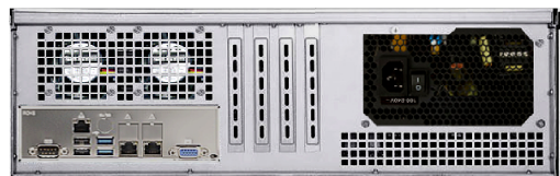
リア (L2/T2 モデル, オプション・リアファン付き)