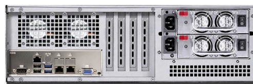
リア (L2/T2 リダundant電源モデル)