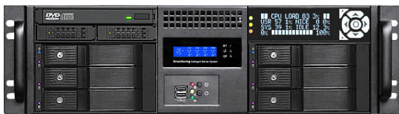
フロント (Slim ODD+2x2.5"ベイ+6x3.5"ベイ+グラフィック LCD)