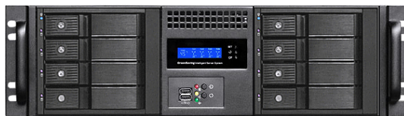
フロント (8x3.5" リムーバブルベイ)