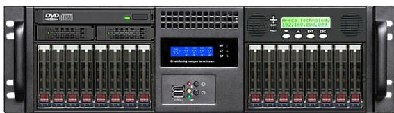
フロント (12Gbps 16x2.5"ベイ+RAID Cont.)