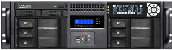
フロント (Slim ODD+2x2.5"ベイ+6*3.5"ベイ+グラフィック LCD)