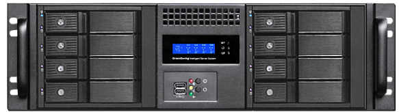
フロント (8*3.5" リムーバブルベイ)