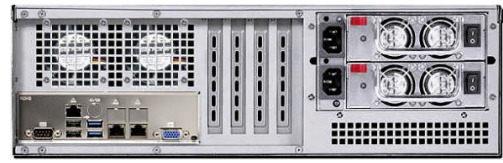
リア (L2/T2 リダundant電源モデル)