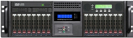
フロント (12Gbps 16*2.5"ベイ+RAID Cont.)